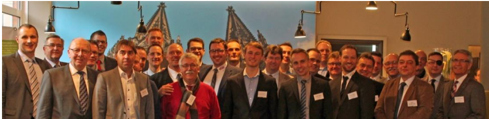
Allianzpartner und Experten der PLA-Spartenangebote beim ersten Systemtreffen in Köln.